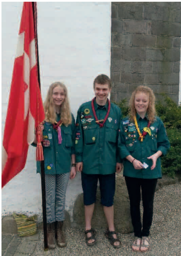
Fra forårets konfirmation.