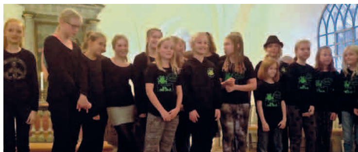
Fra efterårets BUSK-gudstjeneste.

Forsidebilledet forestiller et felt på den trefløjede altertavle i Tibirke Kirke, Helsingør Stift. Tavlen er fra ca 1475-1500.