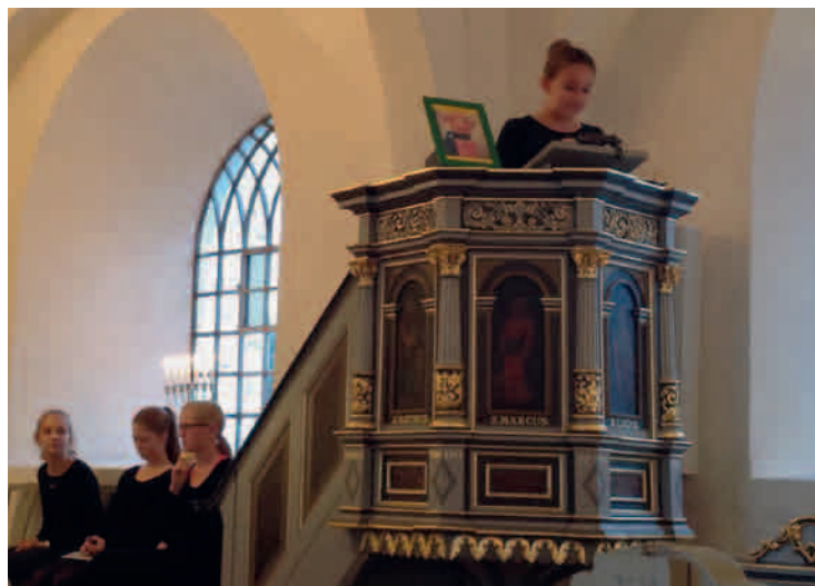
Fra efterårets BUSK-gudstjeneste.

Af nye ting, som de sagkyndige påpegede, var småskader på kirkens tag, så regnvand og fygesne kan trænge ind. Taget arbejder jo, når det blæser, så understrygningen kan smuldre