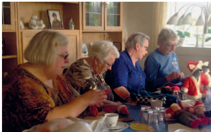
Humlehavens nisseværksted arbejder på højtryk.

Det koster 20 kr. for kaffe og brød. Ofte vil arrangementet indbefatte et aktuelt og/eller spændende foredrag af ca. 2-3 kvarters varighed.