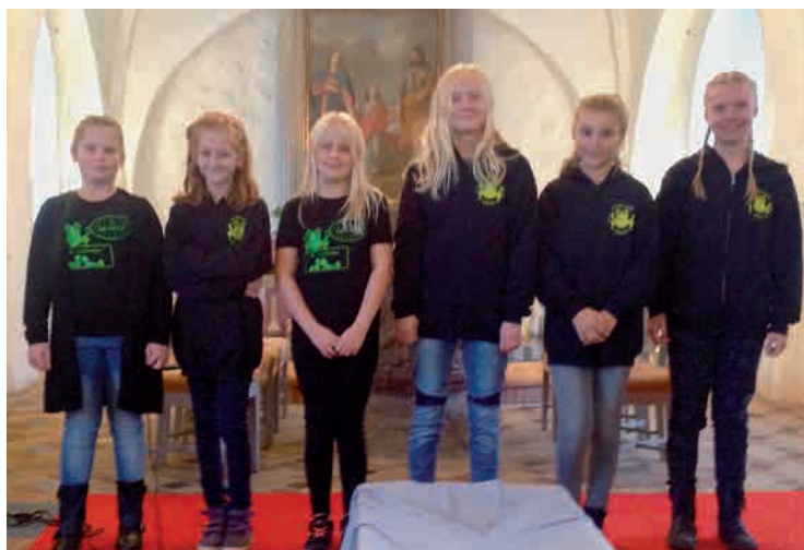
Nr. Lyndelse Kirkes børnekor.

Tlf.: 20 32 01 52 – e-mail: up@hoerlyck-jessen.dk