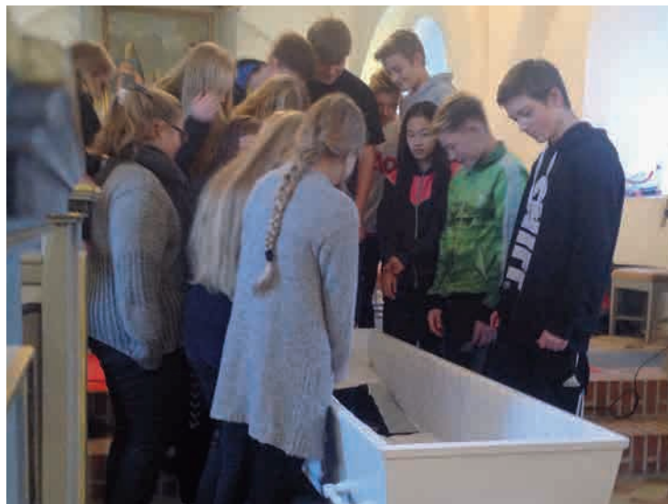
Konfirmanderne afholdt BUSK-gudstjenesten den 30.10.2016.