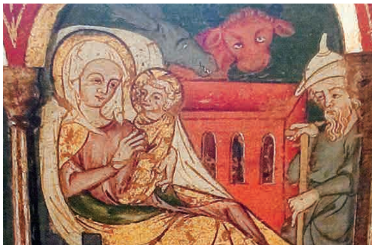
Antependium fra Løgumkloster Kirke.