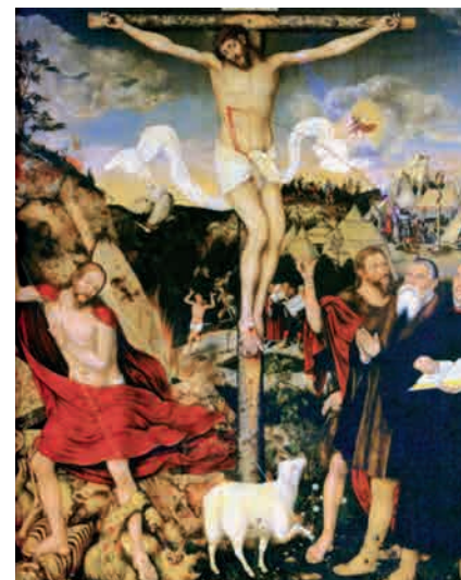
Weimar-altertavlens midterfelt. (Lucas Cranach den yngre, Wiki).

I foredraget følger vi indledningsvis Cranach som maler og hofmaler under de saksiske fyrster. Dernæst de lutherske antipavelige propagandatryk med træsnit fra Cranachs værksted samt Cranachs arbejde med Lutherportrætterne. Mest